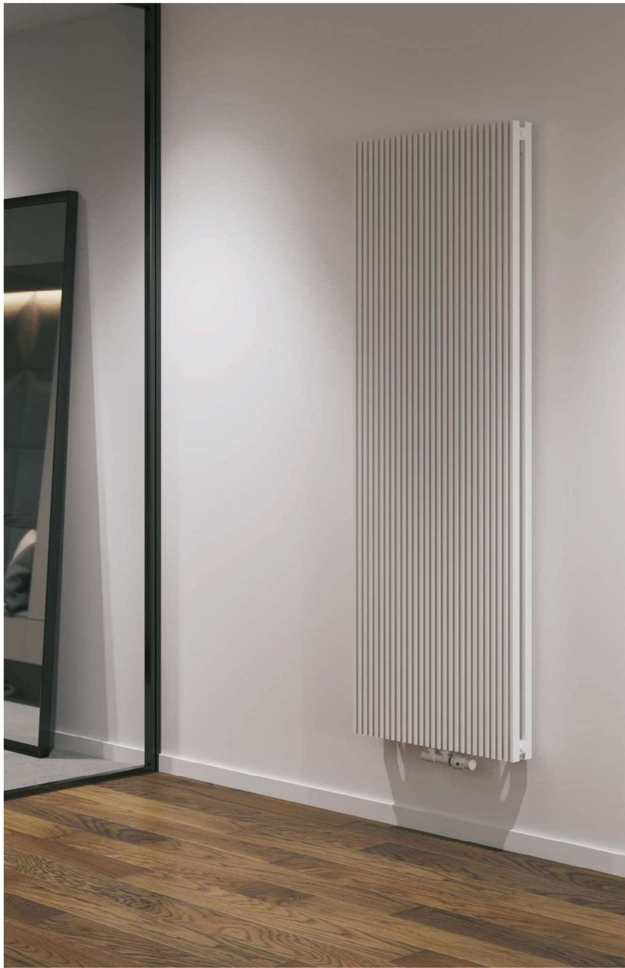
Na aranżacji: grzejnik c.o. AFRN2 -180/28, zestaw zaworowy Z15 In the visualisation: AFRN2 -180/28 heating radiator and Z15 valve set